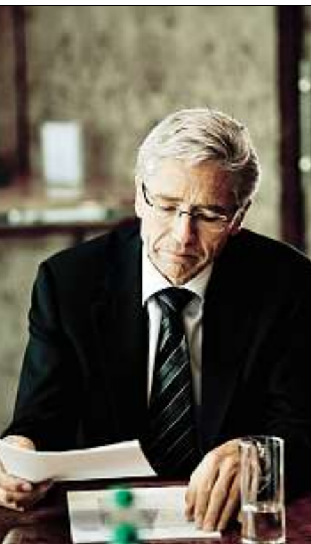
Schmidt Einstellung von Tausenden Mitarbeitern in den kommenden Jahren in China geplant

andrea auler | mdw@wiwo.de, mark.boeschen@wiwo.de